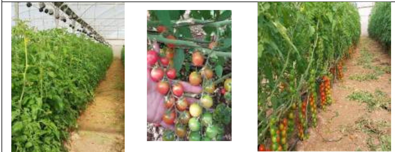
من مشاهدة زراعة البندورة الشيري باستخدام طرق جديدة