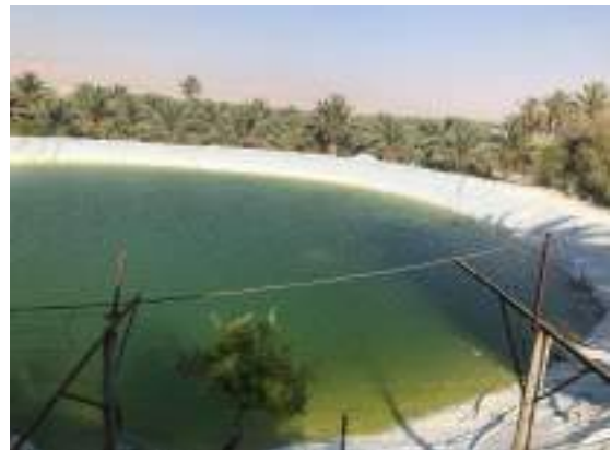
تأهيل بركة العباسية في محافظة اريحا