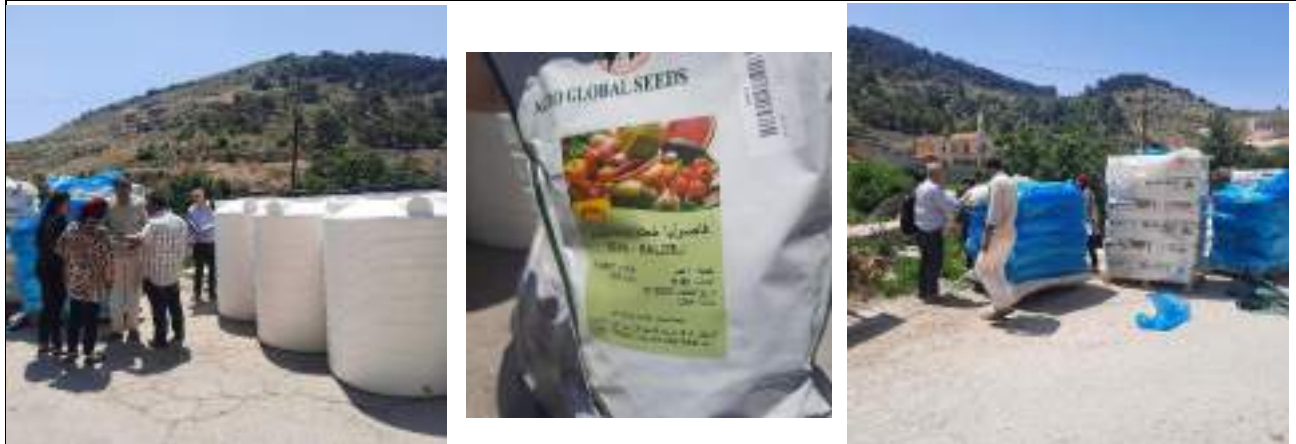
مساعدة مشتل انتاج الخضار في اربطاس