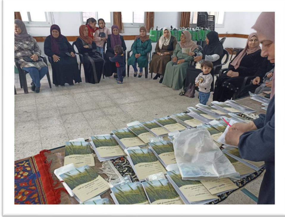
صورة: توزيع التوفيرات في موقع كفر جمال بعد انتهاء دورة التوفير