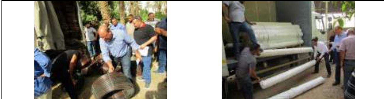
مدخلات زراعية لمساعدة صغار المزارعين