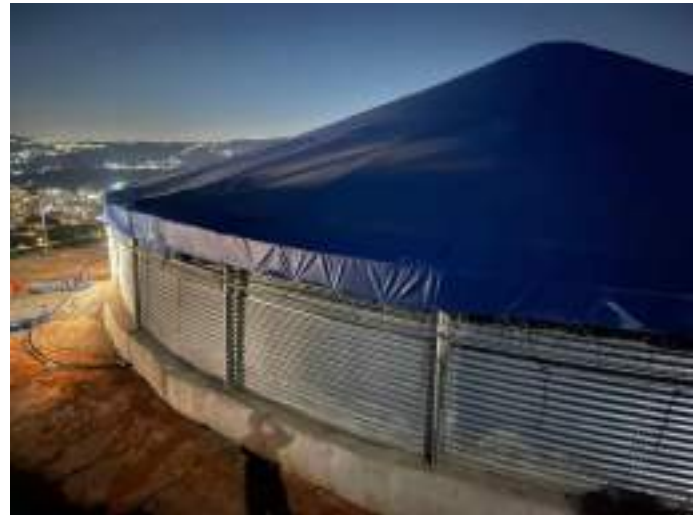
خزان مياه زراعية في طوباس و الخطوط الناقلة