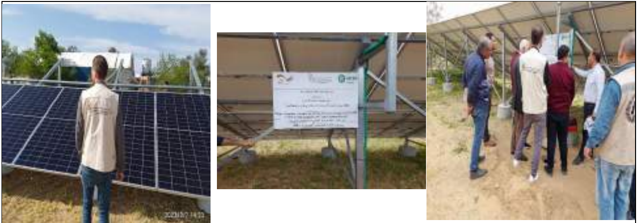
الطاقة الشمسية للبئر الزراعي في غزة

إجمالي المستفيدين من المشروع هو 11246 شخص، بينهم 5229 امرأة و6017 رجلاً.